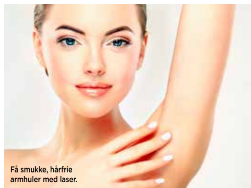
Få smukke, hårfrie armhuler med laser.

Det kendte skønhedshus i Hellerup har fået kosmetiske behandlinger på deres i forvejen store behandlingskort. Både botox, fillers og en helt ny laserbehandling, som effektivt fjerner uønskede hår og karsprængninger.